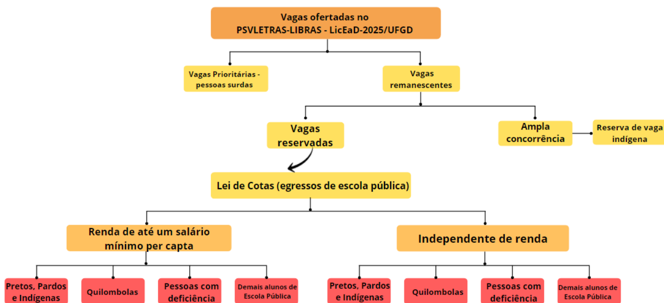
Diagrama 4 (Edital de Retificação CCS n.º 03/2024)

4.8. O candidato deverá escolher a faixa de renda per capita em que se enquadra, selecionar sua cor/raça, informar caso se enquadre, nos termos da lei, como PcD, e ainda indicar se é quilombola.